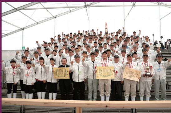
第12回全国和牛能力共進会宮崎県出品者及び関係者